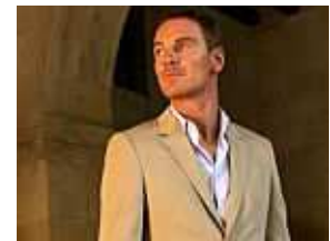
The Counselor (Trailer)