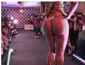
Brasiliens heißester Hintern