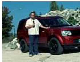
Fahrbericht: Land Rover Discovery