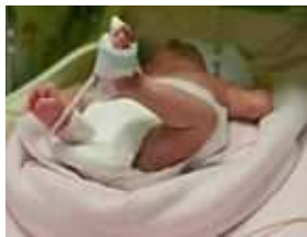
Drei Monate nach Tod der Mutter geboren